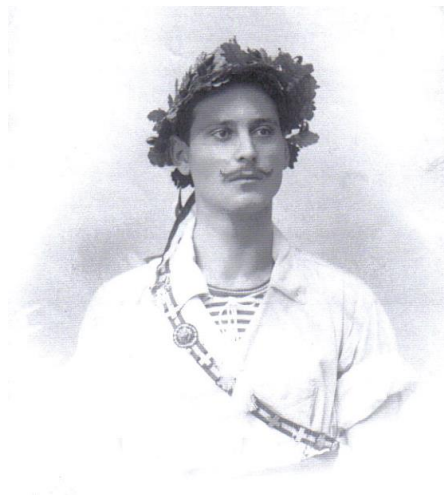
Gymnaste anonyme fin XIXème siècle

Un simple portrait de gymnaste s'étant illustré lors d'un concours peut en dire beaucoup plus long que simplement marquer une anecdote compétitive... Regard lointain, port de tête, manches retroussées, lauriers et sautoirs témoignages d'exploits... peuvent à bien des égards symboliser l'expression de la virilité moderne et de l'idéal masculin.